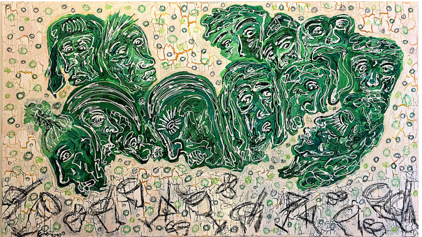
Prinks 80 X 140 MIXED MEDIA ON CANVAS

Die Bilderserie widmet sich der situationsabhängigen Wahrnehmung der sich schnell verändernden Realität. Den lebhaften, sich durch das Gedränge befeuerten Figuren werden groteske Gesichter gegenübergestellt, die nach einer bemerkenswerten Party kaum den Kopf über den Tisch halten können.