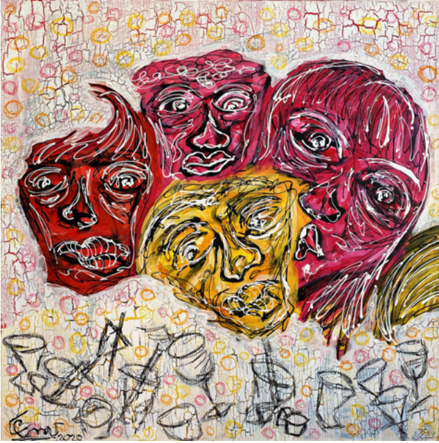
After 100 X 100 MIXED MEDIA ON CANVAS 800€