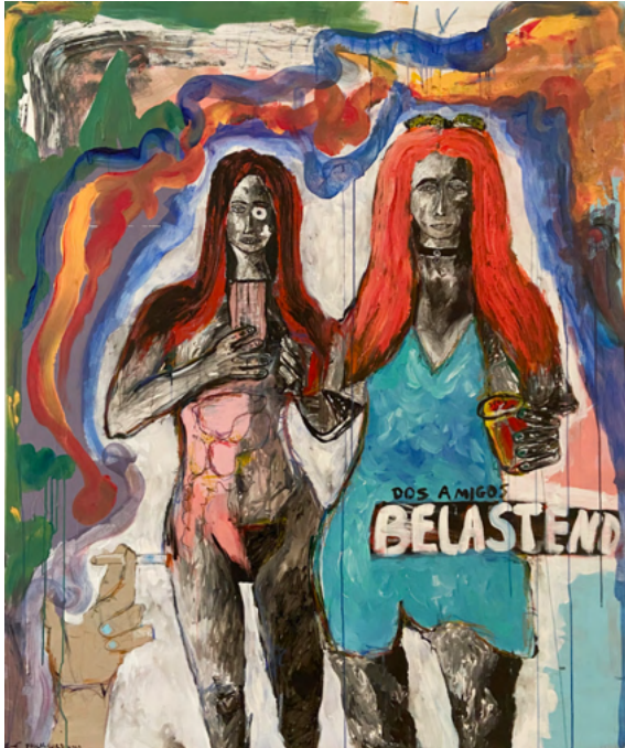
ESOTERIK & YOGA 180 x 150 Acrylic on canvas 2150 €