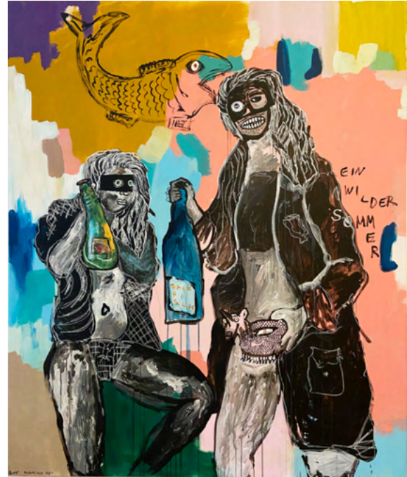
BACKFISCH 180 x 150 Acrylic on canvas 2150 €