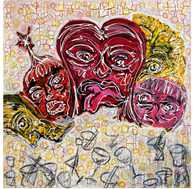
Hour 100 X 100 MIXED MEDIA ON CANVAS 800€